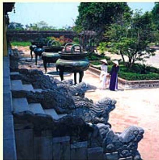
Les neuf armes de Huế