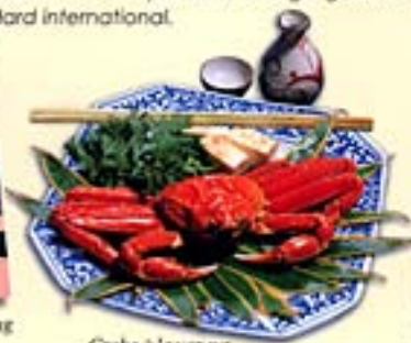
Crabe à la vapeur