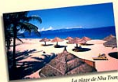
La plage de Nha Trang

Pour l'hébergement, les visiteurs pourront choisir parmi une large gamme d'hôtels. La majorité des hôtels dans les grandes villes sont de standard international.