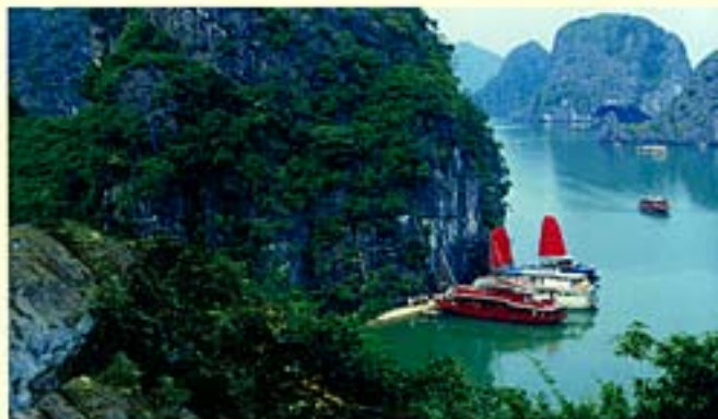
La baie d'Halong

Le vietnamien est la langue nationale officielle qui sert de véhicule commun à la culture. Avec le développement du pays, plusieurs langues étrangères sont utilisées au Vietnam dans le cadre des échanges internationaux comme l'anglais, le français ou le chinois.