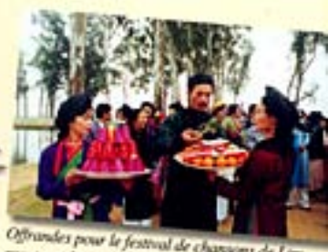
Offrandes pour le festival de chansons de Lim, province de Bac Ninh