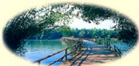
Pont de bambou