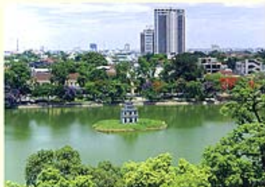
Lac Hoan Kiem, Hanoi