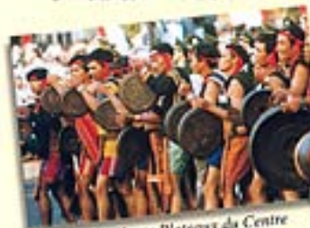
Festival des Hauts Plateaux du Centre

La population vietnamienne est d'environ 76,5 millions d'habitants (en 1999). Il y a 54 ethnies distinctes qui vivent sur le territoire vietnamien, dont les Viets (ou Kinh) représentent près de 80 %. Parmi les autres groupes, on compte les Tays, les Muongs, les Chinois, les Khmers, etc.