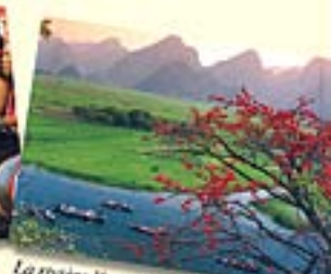
La rivière Yen menant à la pagode des Perfumes