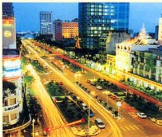
Hồ Chí Minh-Ville la nuit

Tous les bureaux administratifs sont ouverts de 7 h 30 à 16 h 30 (avec une heure de pause à midi) du lundi au vendredi.