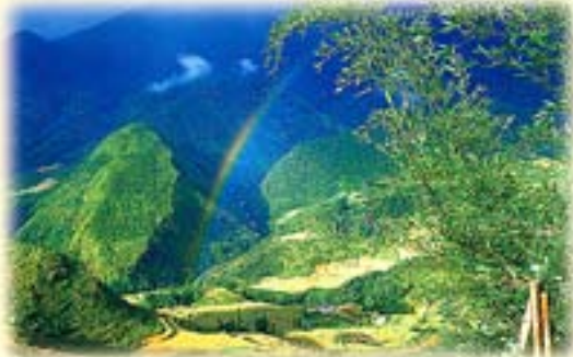
Un paysage de Thanh Hoa

Les chèques de voyage peuvent être échangés dans la plupart des banques. Les cartes de crédit sont de plus en plus couramment acceptées dans les agences de voyages, les hôtels et les grands restaurants de Hanoi et Hồ Chí Minh-Ville.